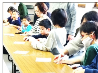
次は 折り紙で お ひな様を折ります