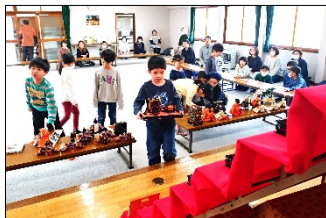
アイテム各種を順番に運びます