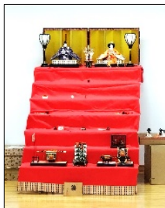
最初は豪華な7段飾 りもこなふう