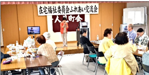
カラオケも盛んです