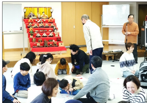
最後はカルタ大会 今回も「配膳式」