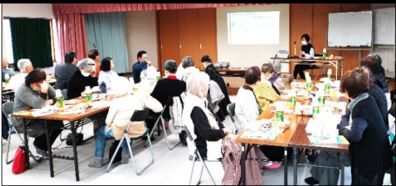
先月20日は 出前講座 「在宅医療について」もありました