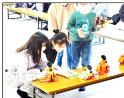
説明図で飾る場 所を確かめて