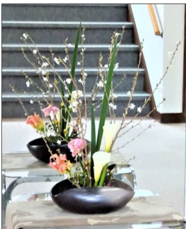
今月の会館のお花